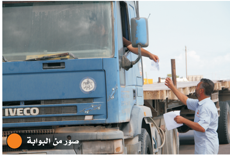
صور من البوابة

في الحقيقة هناك بعض الحالات ولكن لا نستطيع أن نصنفها على أنها أعمال إرهابية فمثلاً هناك بعض من مخلفات حرب التحرير من ذخائر وقذائف تأتي مع الخرقة بشكل غير متعمد فنقوم بالاتصال بسرية الهندسة العسكرية مشكورين على تعاونهم معنا للتعامل مع هذه الأشياء التي هي نادرة ما تحدث وتم كشفها قبل دخولها للأفران.