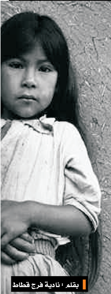
بقلم : نادية فرج قطاط

قمت بغسل فستاني بالماء مراراً وتكراراً، فما إن أغسله بيدي حتى تزداد بقعة الزيت في الاتساع وكذا رقعة الأرض التي تجمعني بهن والتي أتمنى أن ادفن في بطنها كشهيدة الجوع والتسول.. عندها لن يبخسني تاجر المواد الغذائية قطعة صابون لتغسيلي بها ولن يتأخر تاجر الأقمشة عن التصديق بقطعة قماش نظيفة كي تلتحف جسدي الصغير.. يا لقساوة القدر والبشر ومن لا يعرف الوجه القبيح للفقر .. ههههه قطعة صابون ومزيل عرق .. إنها يا سيديتي من الكماليات التي تحصل عليها من قمامة سيدة البيت الذي تعمل لديها أمي الصابرة كخادمة .. مرتب والدتي لا يكفيها لهذا أمور فأنا طفلة لم تحتس العصير قط ولا تعرف مذاق فاكهة التين التي قالت لي معلمة التربية الإسلامية إنها من ثمار الجنة .. ثم أسعدت قلبي عندما أشارت في نهاية الحصة إلي "أن الفقراء سيدخلون الجنة قبل الأغنياء بخمسمائة عام" .. اعتقد أنك يا قدوتي يا أخصائيتي لا تعرفين شيئاً عن بيوت المحرومين و المساكين.