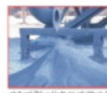
شكل (5) مخلفات القشور الناتجة من الفرن

الكمية السنوية لمجمل هذه الأنواع من القشور بحوالي (6.000 طن)، والشكل (5) يوضح صورة لمخلفات القشور، في حين يوضح الجدول (5)