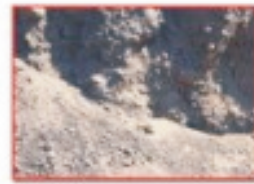
شكل (3) الغبار الناتج

ينتج الغبار عن منظومات السيور الناقلة للحديد المختزل إلى أفران