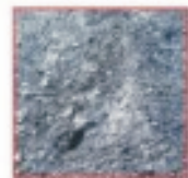
شكل (6) مخلفات الأكاسيد

تتساقط هذه الأكاسيد نتيجة للمعالجة الكيميائية للفضات المدرفلة على الساخن حيث تفصل عن حوامض