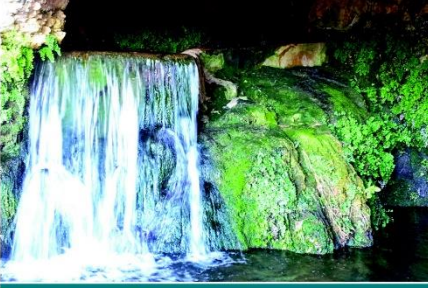
شحات (نبح ابولو)