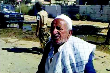
الشيخ المجاهد: مفتاح العكروت

((أمسح مسح ومتجيبيلش حد وأيدك عالزناد والثقة نوو)) هذه ليست لغة جديدة جاءت بعد الثورة يرددها بعض الشباب هذه الأيام من اختصار في الكلمات وتهكماً على لغتنا الأصلية، بل هي صادرة من رجل مسن تقدمت به السنون، ومر على مراحل الحياة وأخذ منها ما أخذ ليقدمه للأجيال اليوم، كان هذا الشيخ الهرم يرفع من معنويات الثوار ويحثهم على الجهاد والنضال بخبرته الطويلة طبعاً، هذه النصيحة يتناولها الناس هذه الأيام ويتناقشونها فيما بينهم عن طريق الهواتف المحمولة.. والكل متحمس ويتمنى أن يعمل بها.. ربما لديهم الحق في ذلك لأننا نحن الآن في أمس الحاجة إليها، لأن استعمالها يبدو أنه مفيد جداً (( بالتجربة طبعاً )) لكي تلجم أفواه من خانوا الثورة، ووقفوا بعيداً عن محطات الوطن وتشل حركة من يحاول القفز عن شوايت الثورة . أليست الكلمات الصادرة من هذا الرجل دليل على خبرته في الحياة وأتى بها لكي نستفيد منها نحن في هذا الوقت العصيب، أليست النصيحة بجمل كما يقولون ، ها قد جاءتنا مجاناً دون أن نطالب بإحضار جمل ما أوحجنا في هذه الأونة إلى تطبيق تلك العبارة على البعض .