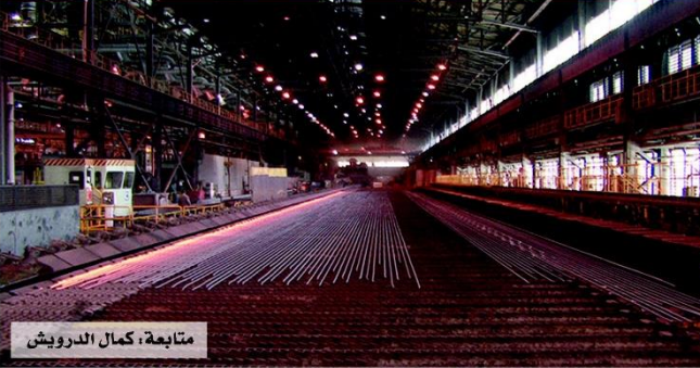
متابعة: كمال الدرويش