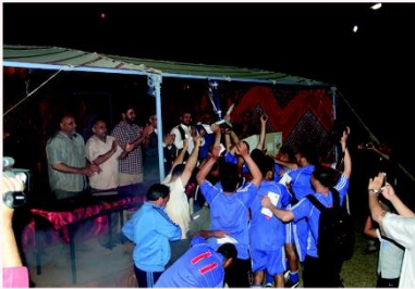
13 - تسليم كأس الدوري للفريق صاحب الترتيب الأول .