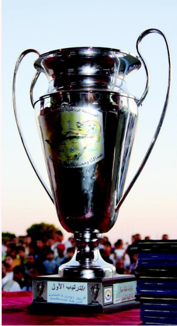
12 - جائزة الترتيب الأول في مسابقة كرة القدم (فريق الإدارة العامة للدرفلة المسطحة).

كما لا يفوتنا أن نتقدم بالشكر لكل التقسيمات التنظيمية بالشركة على حسن تعاونهم ومشاركتهم الفعالة في إنجاح هذه الاحتفالية .