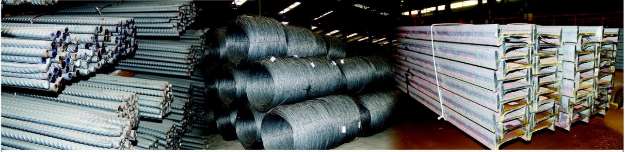
أسعار حديد التسليح