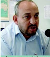
د. اللويدز "LLOYDS" الشهيرة

بلندن ومارست نشاطها في التأمين ضد الحريق. ثم ظهر التأمين على الحياة في إنجلترا أيضاً. وقد اعتبر في ذلك الوقت منافياً للأخلاق مما جعله لا ينتشر إلا بعد اكتساب الشرعية القانونية في هذه الدول في النصف الثاني من القرن الثامن عشر بعد تمكن علماء رياضيات التأمين من وضع جداول