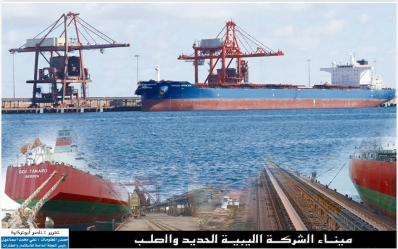
تحرير : ناصر أورتوك مصدر المعلومات : علي محمد اسماعيل رئيس اللجنة دراسة الاستثمار والطاقة