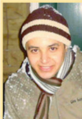
حسام الدين الثاني