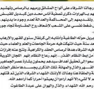
7 مهرجان المشائق